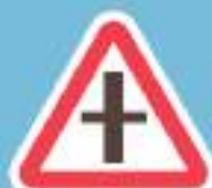
Знак имеет значение для велосипедистов в зависимости от угла примыкания дороги

Предоставляет право преимущественного проезда нерегулируемого перекрестка транспортным средствам, находящимся на главной дороге. На таких перекрестках разрешается обгон на дороге, являющейся главной по отношению к пересекаемой. Но велосипедистам при обгоне или повороте следует убедиться, что их видят водители.