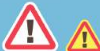
Если знак имеет белый фон, то знак является временным

Знак устанавливается перед участками дорог, опасности на которых не предусмотрены другими предупреждающими знаками.